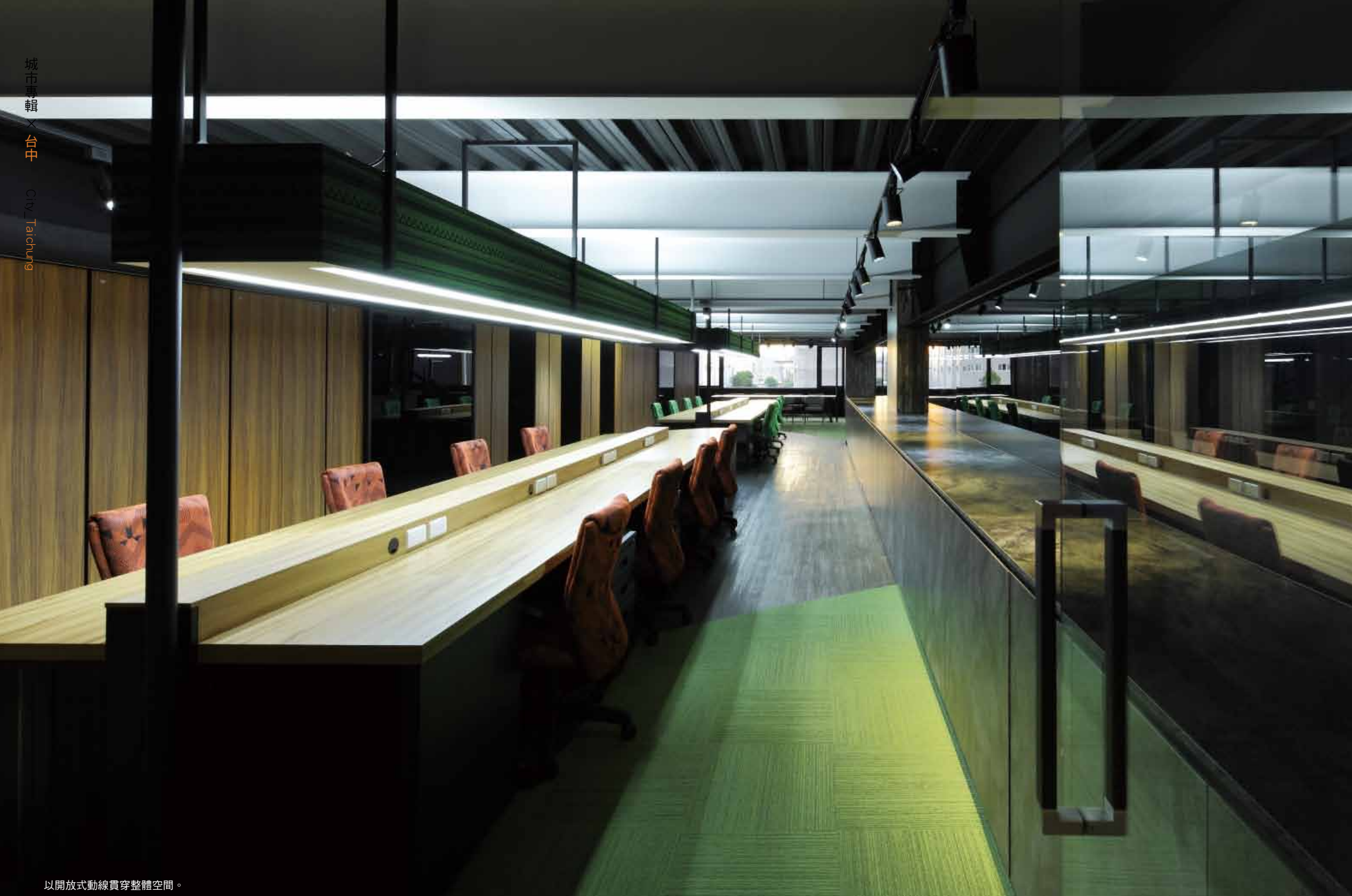
以開放式動線貫穿整體空間。