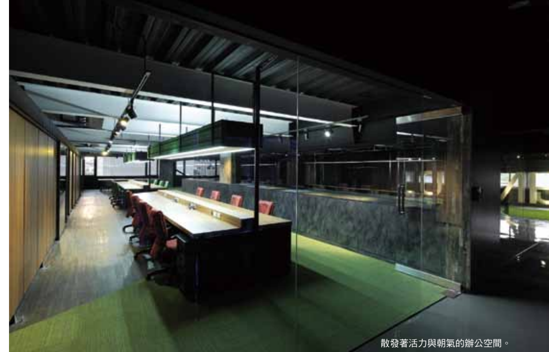
散發著活力與朝氣的辦公空間。