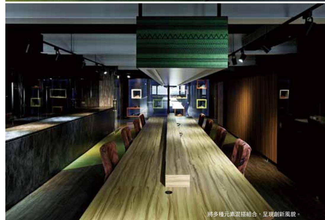
將多種元素混搭組合，呈現創新風貌。