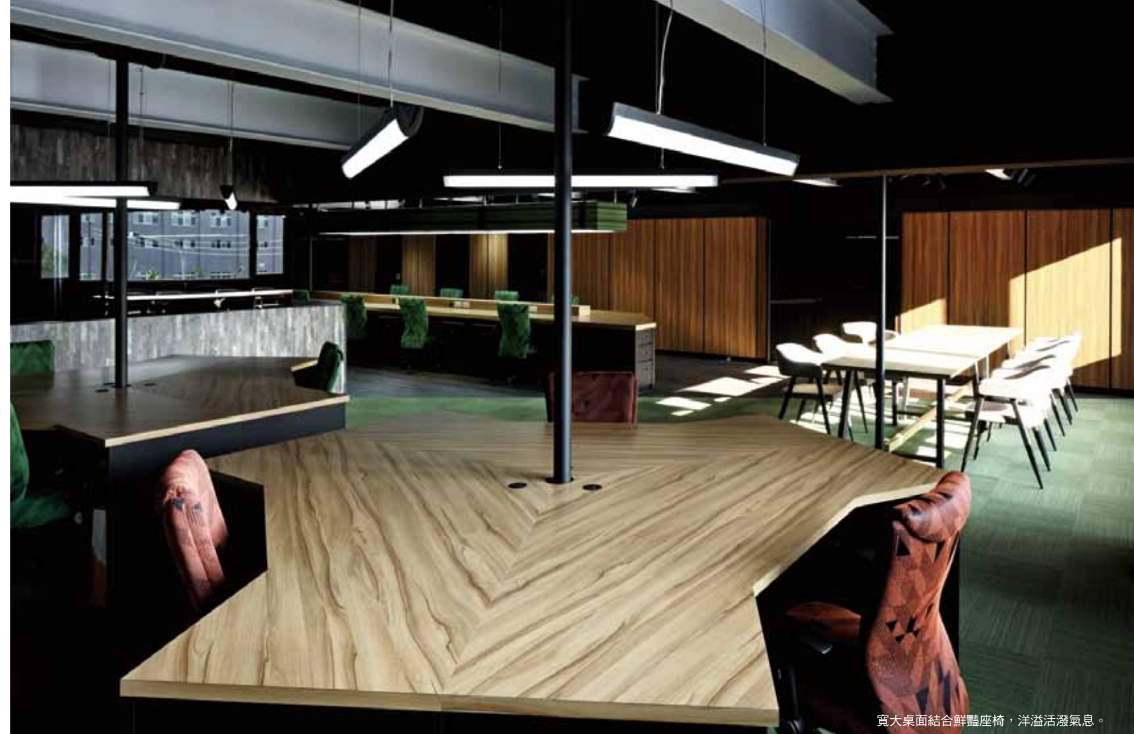
寬大桌面結合鮮豔座椅，洋溢活潑氣息。

展示牆面使用大片變色並鑿洞的 LED 燈，讓光影大面積透出，使其商品更加耀眼，在牆面、桌面、地面等皆以不同層次的木作裝飾，利用投射燈反射，以彰顯木質質感的溫潤色澤，鋪陳出無壓的空間感受。並採用具吸音、抗菌、防潮的日本進口地磚，搭配木質地板做切割拼接來增加它的層次，輔以流線造型增添趣味，整體空間風格一致卻不失巧思，除了美感的賦予，設計師更強調人與人的互動關係，種種布局與營造，讓辦公環境揮別了枯燥的刻板印象，取而代之的是一股蓬勃的生氣及活力。