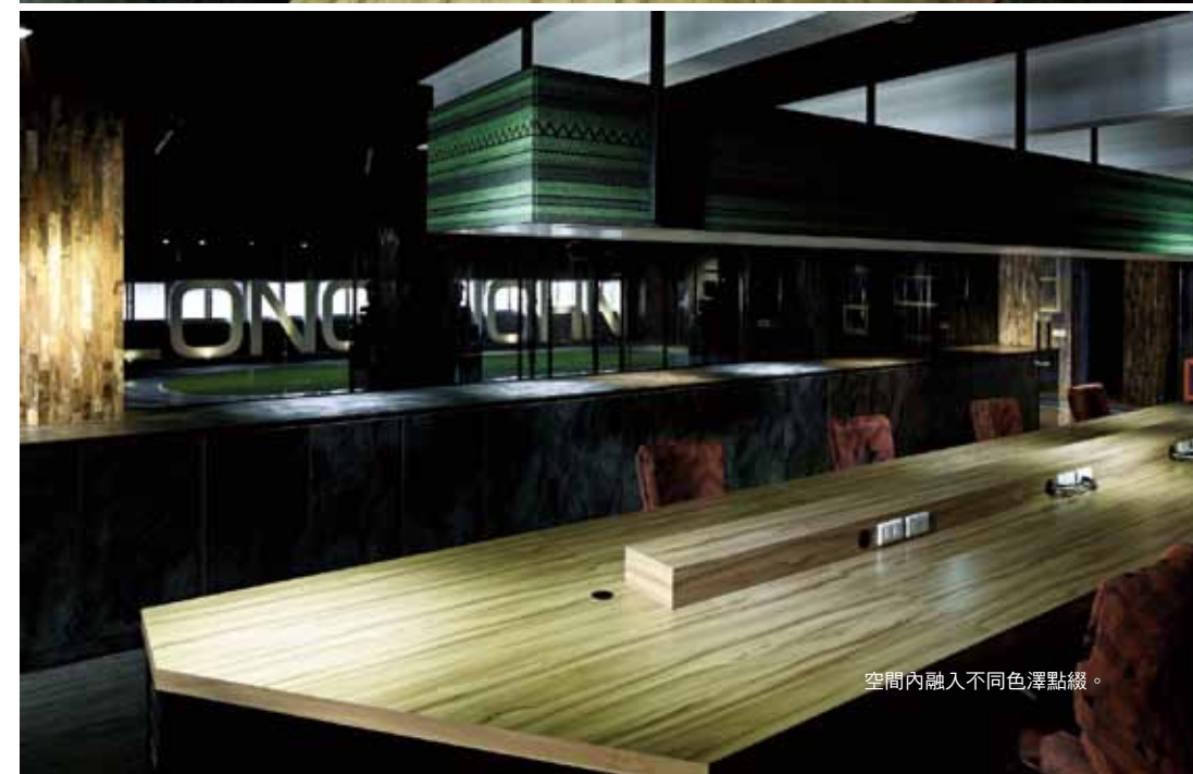
空間內融入不同色澤點綴。

設計 / 王毓婷 參與設計 / 陳見行、李孟濂 設計公司 / 聯寬設計 電話 / 04-22030568 e-mail / rkdesign@rkdesign.com.tw 地址 / 台中市北區英才路 260-6 號七樓 空間性質 / 辦公空間 座落位置 / 彰化北斗 面積 / 170 坪 主要建材 / 鐵件、富美家美耐板、清玻、灰玻、 EPOXY、系統板、塑膠地磚、方塊 地磚 完工時間 / 2015 年 7 月