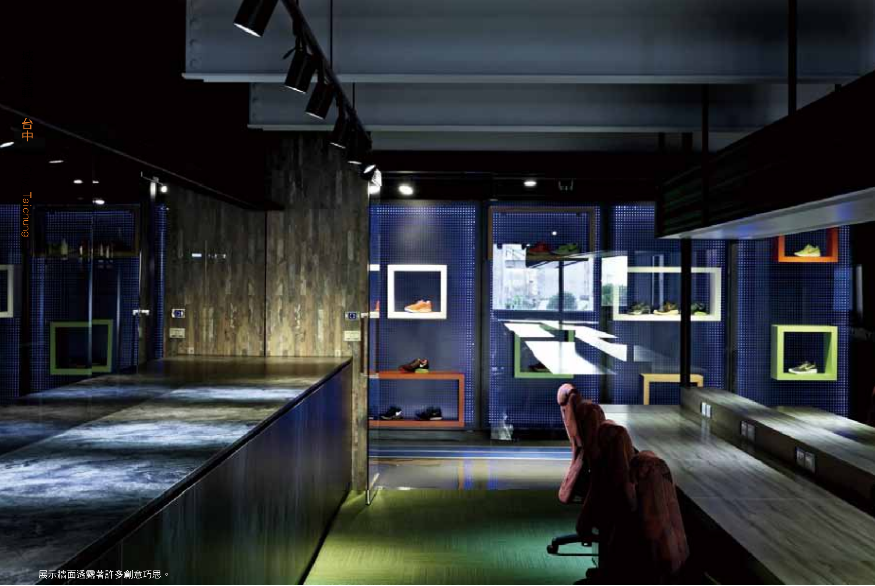
展示牆面透露著許多創意巧思。