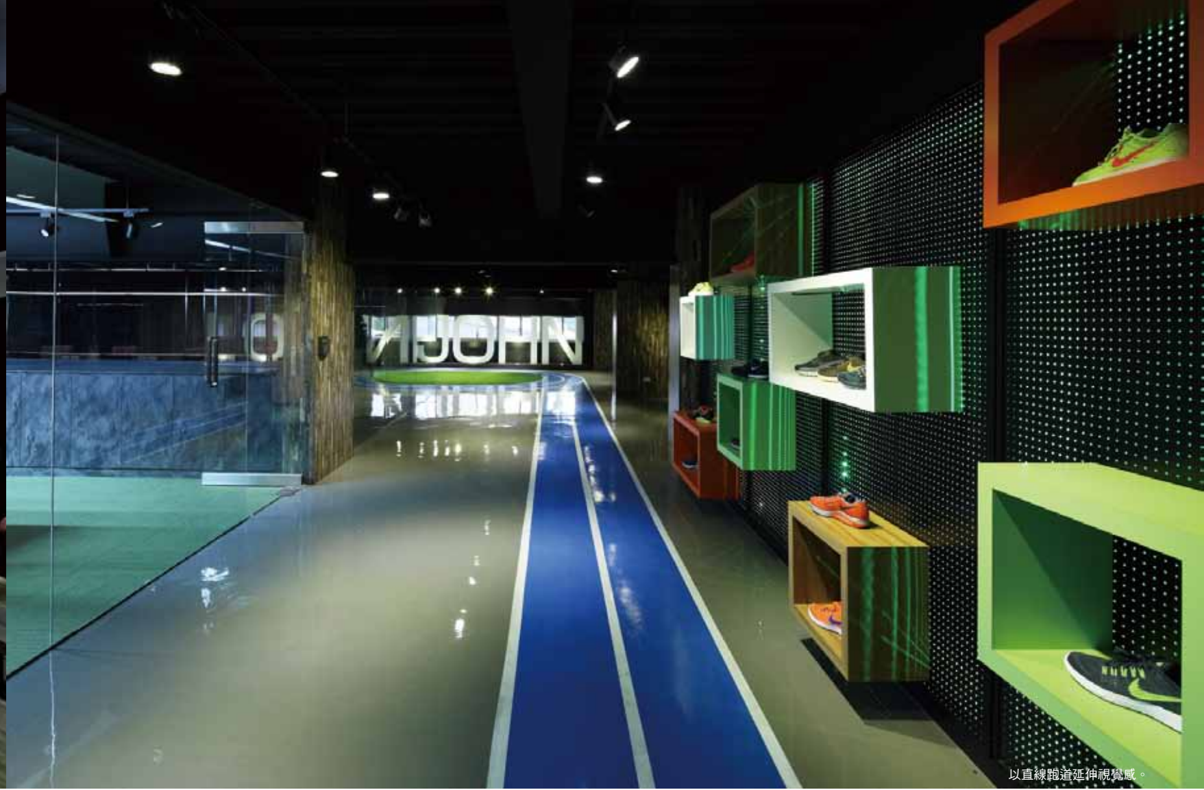
以直線跑道延伸視覺感。