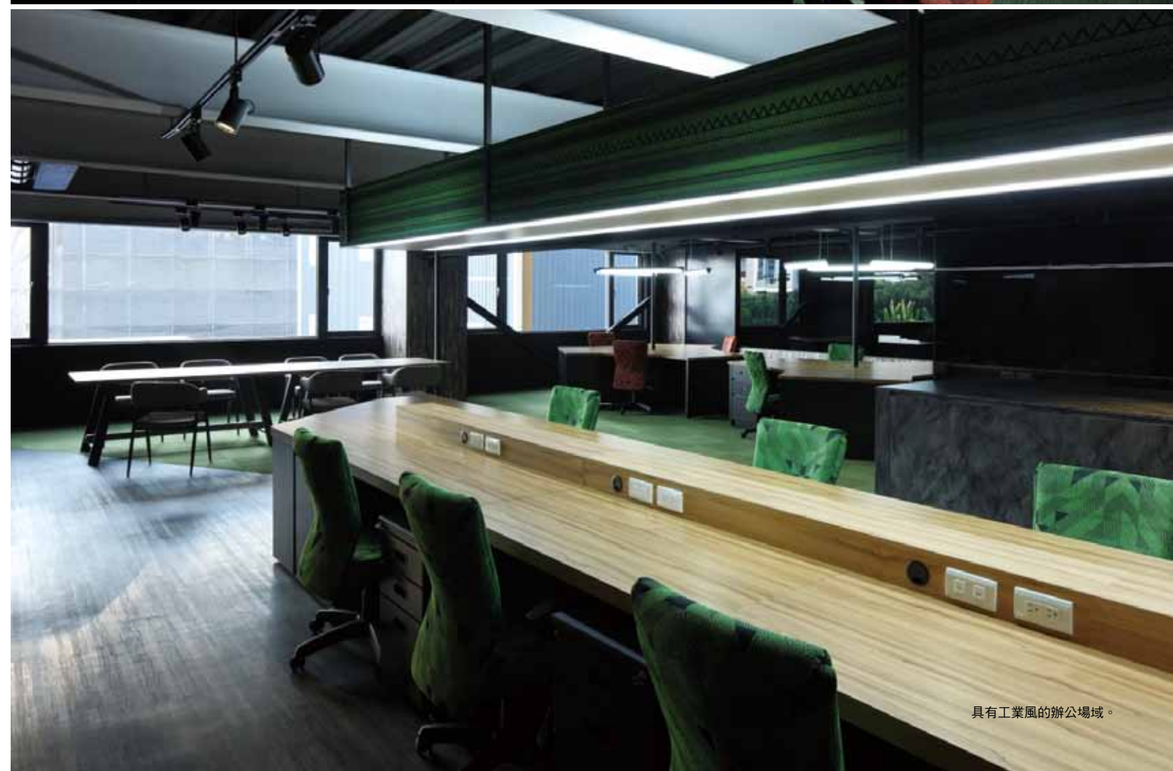
具有工業風的辦公場域。