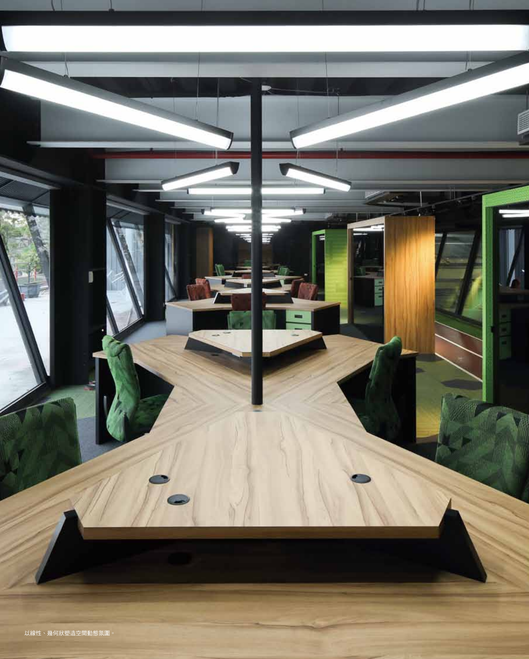
以線性、幾何狀塑造空間動態氛圍。