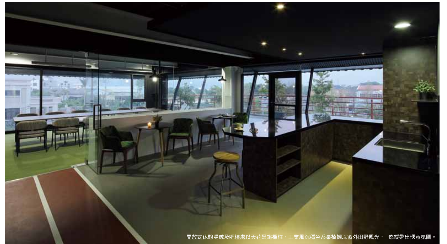
開放式休憩場域及吧檯處以天花黑鐵樑柱、工業風沉穩色系桌椅襯以窗外田野風光，悠緩帶出愜意氛圍。